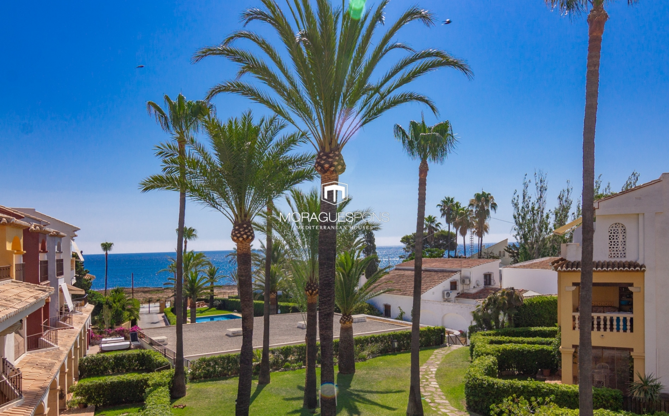
Apartment in erster Meereslinie – Montañar I, Jávea MONTAÑAR - EL ARENAL, JÁVEA/XÀBIA - REF. A-1474