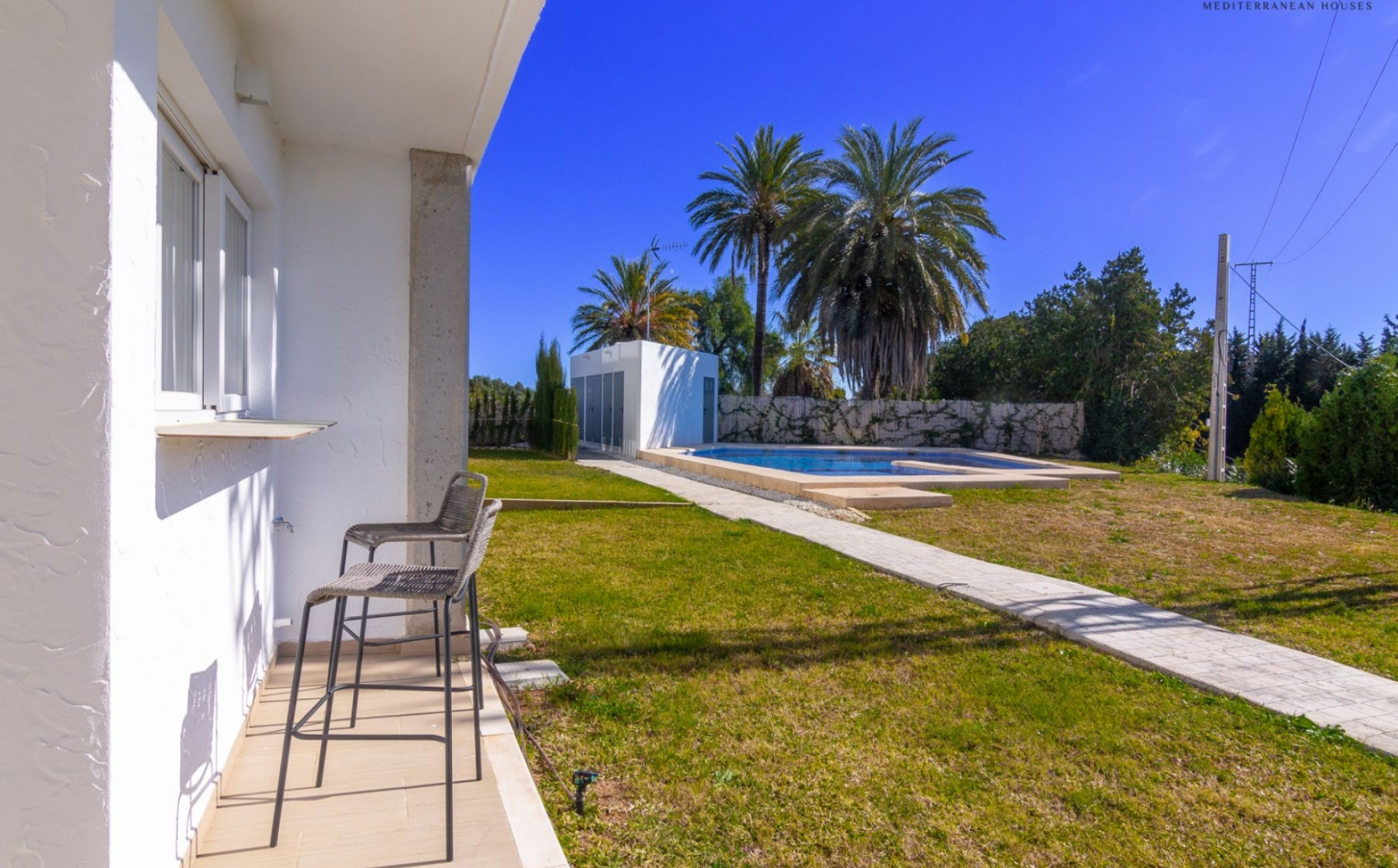
Neu fertiggestellte Stadthäuser in Jávea. ALTSTADTZENTRUM, JÁVEA/XÀBIA - REF. VR-6