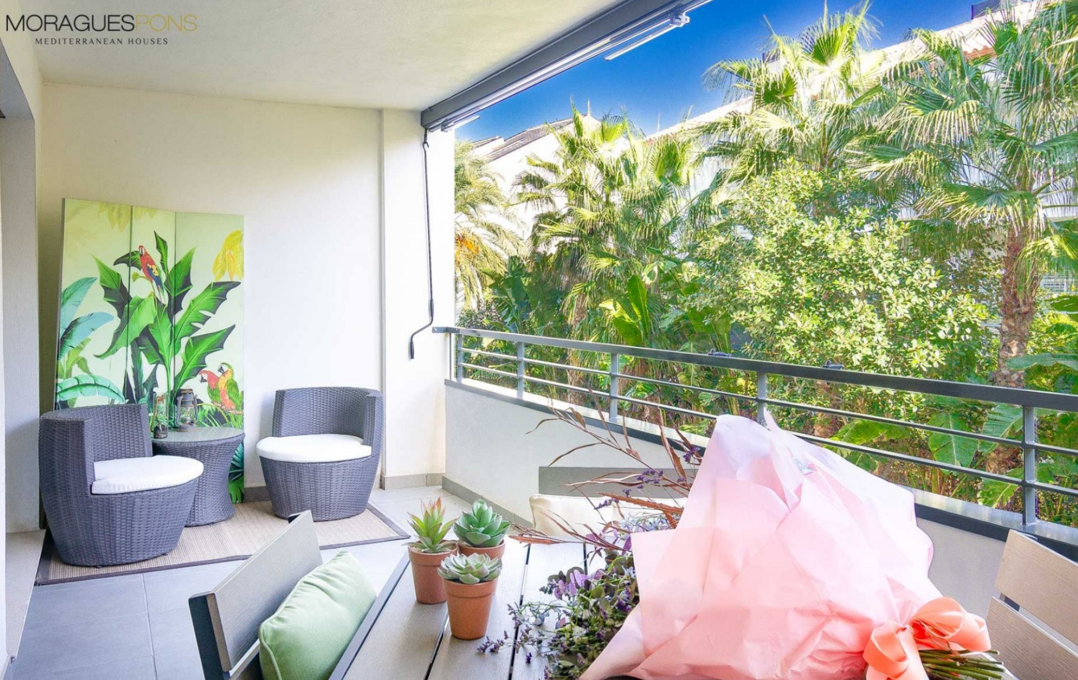
neue Wohnung in Javea in der Nähe des Strandes MONTAÑAR - EL ARENAL, JÁVEA/XÀBIA - REF. A-347