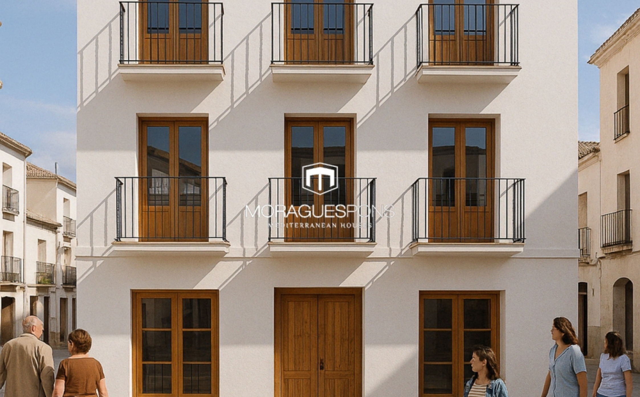
Typisches zweistöckiges Stadthaus und Geschäftsräume in Jávea ALTSTADTZENTRUM, JÁVEA/XÀBIA - REF. VP08