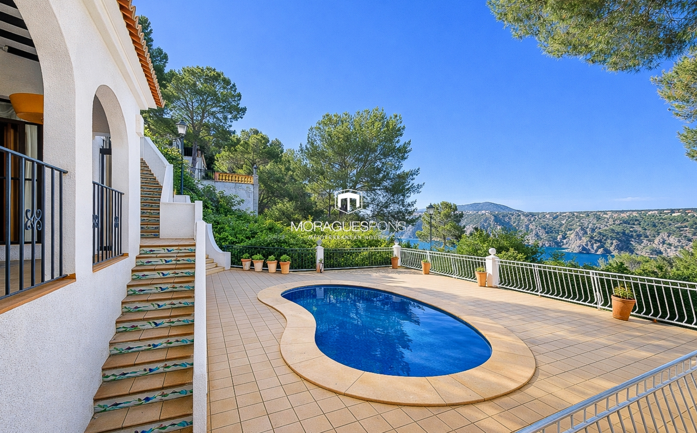
Villa zum Verkauf in Torre Ambolo, Jávea mit Meerblick BALCÓN AL MAR - PORTICHOL, JÁVEA/XÀBIA - REF. V-1600