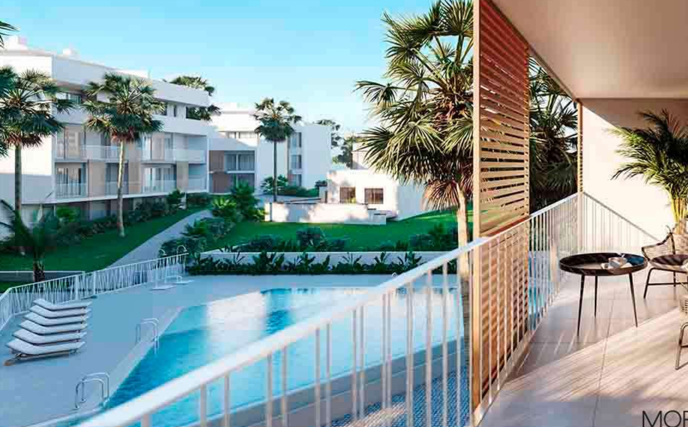
Wohnung im ersten Stock in der UNIC-Siedlung in Jávea. ALTSTADTZENTRUM, JÁVEA/XÀBIA - REF. UNIC 241G