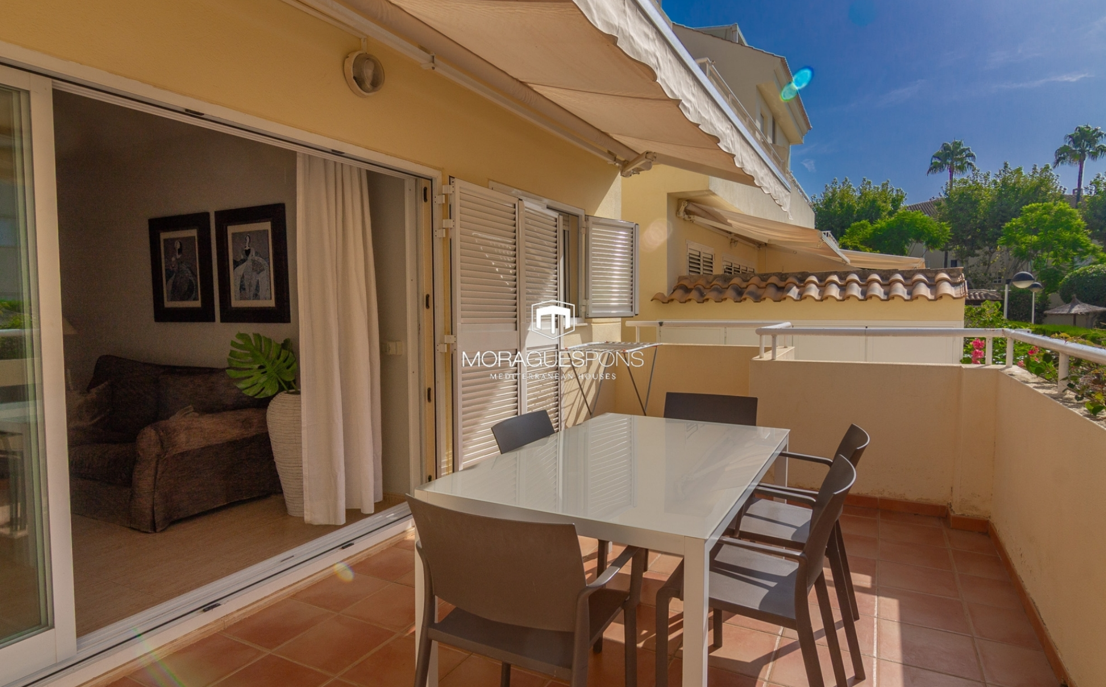
Erdgeschosswohnung in der Calle Génova – Saisonvermietung von September bis Juni MONTAÑAR – EL ARENAL, JÁVEA/XÀBIA – REF. A-1490