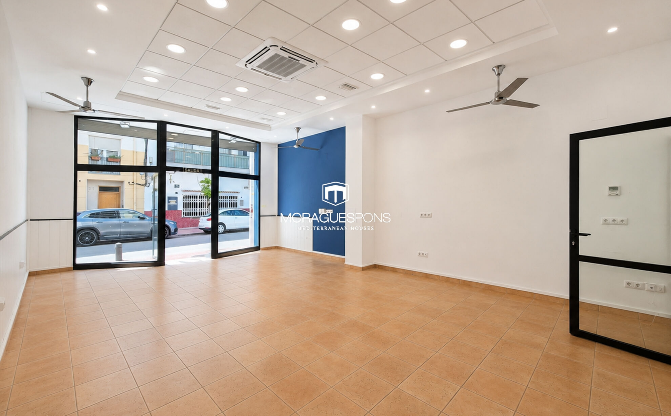
Local commercial avec excellente visibilité dans le Port de Jávea PORT, JÁVEA/XÀBIA - REF. LC-1688