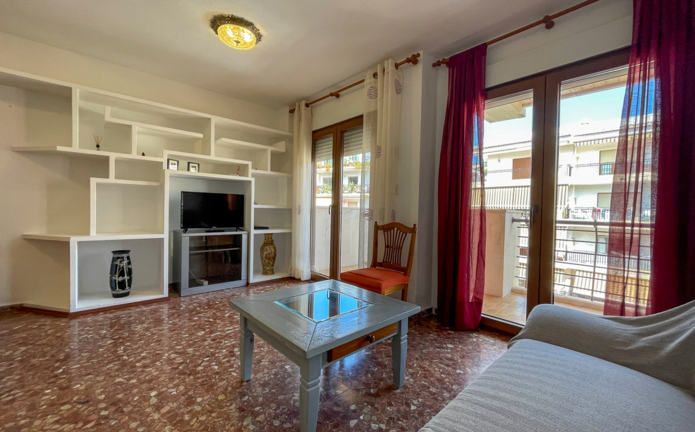
Location à long terme dans le port de Jávea PORT, JÁVEA/XÀBIA - REF. A-600