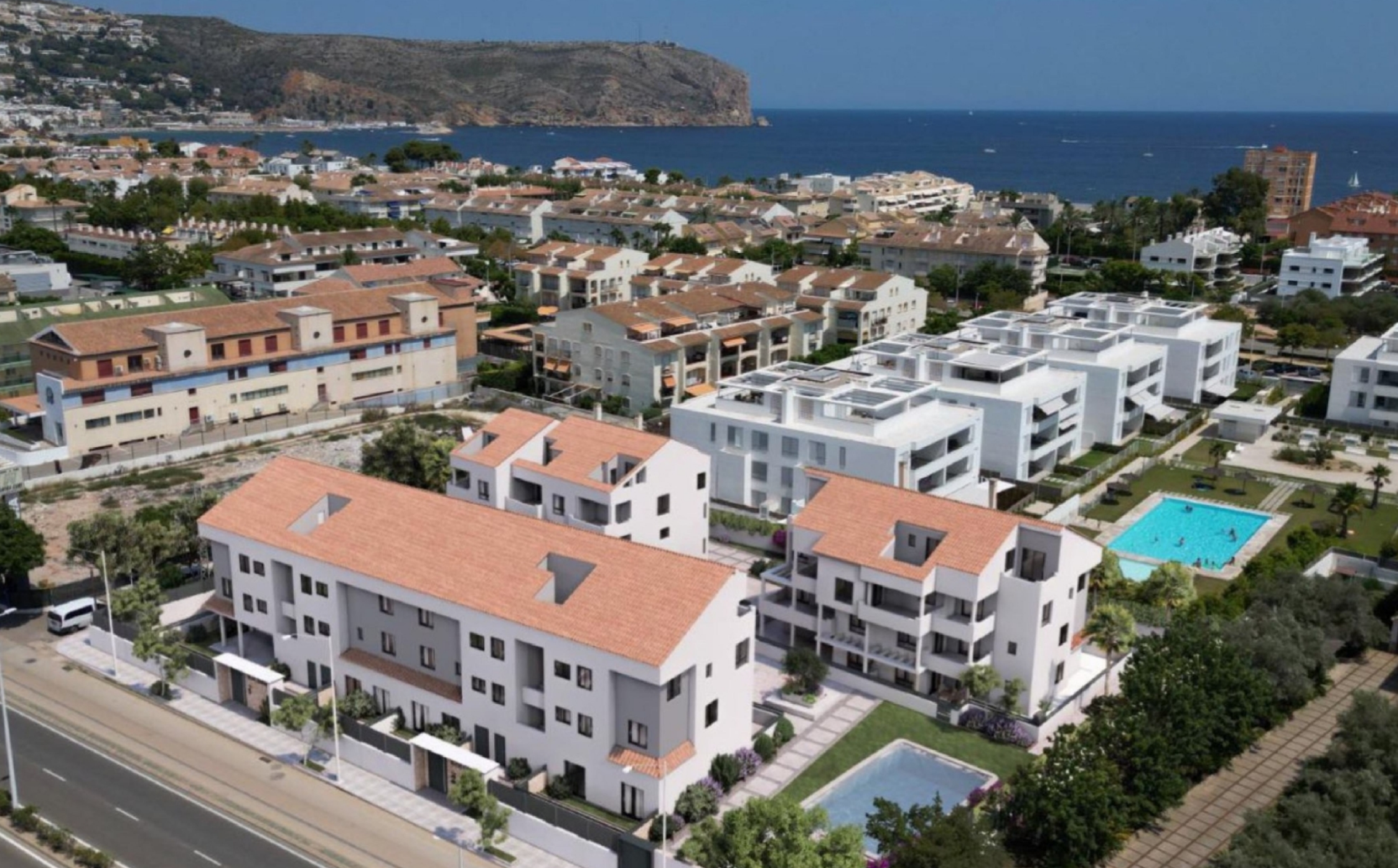
Duplex en dernier étage à BLUE GARDENS, JÁVEA MONTAÑAR - EL ARENAL, JÁVEA/XÀBIA - REF. BG426