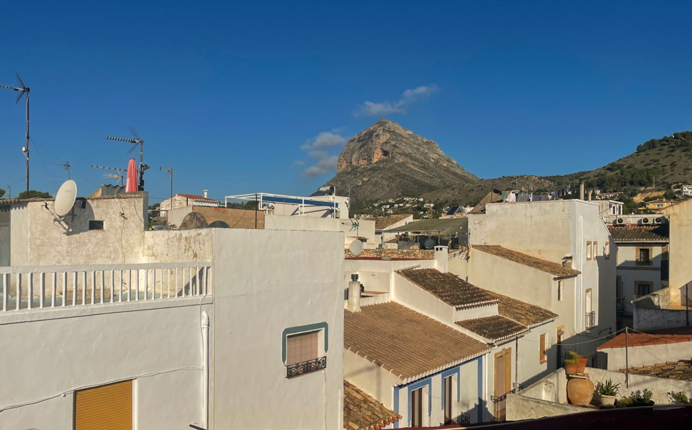
Maison de ville à rénover à Jávea VIEILLE VILLE, JÁVEA/XÀBIA - REF. V-310