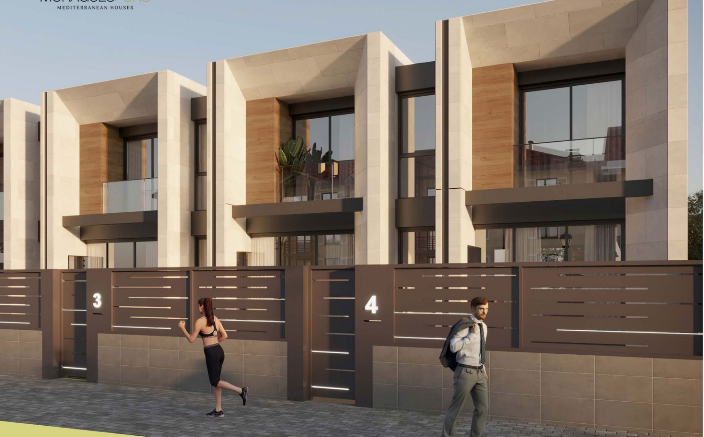
Maison mitoyenne avec piscine privée à Gata de Gorgos GATA DE GORGOS - REF. NATURE 2