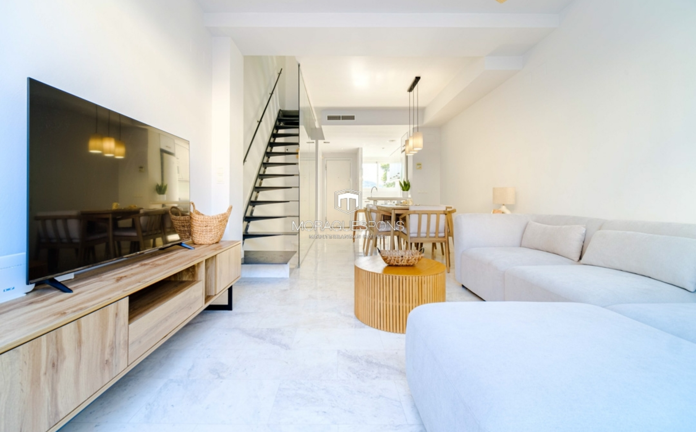
Maison mitoyenne exclusive avec vue et piscine à Jávea – Quartier de l’Arenal MONTAÑAR - EL ARENAL, JÁVEA/XÀBIA - REF. A-156