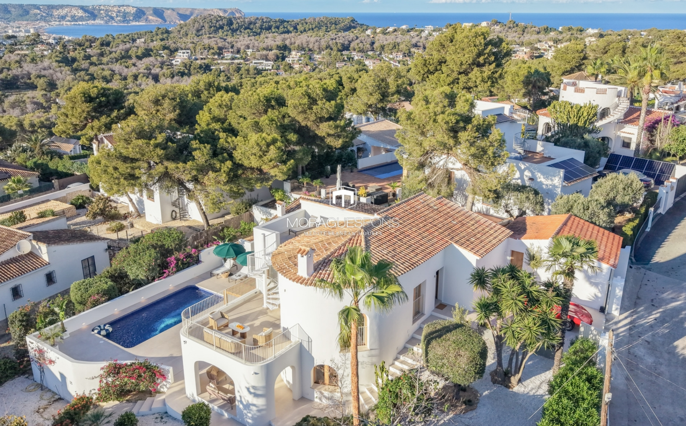
Villa à Balcón al Mar avec vue sur la mer et le Montgó, Jávea BALCÓN AL MAR - PORTICHOL, JÁVEA/XÀBIA - REF. V-1602