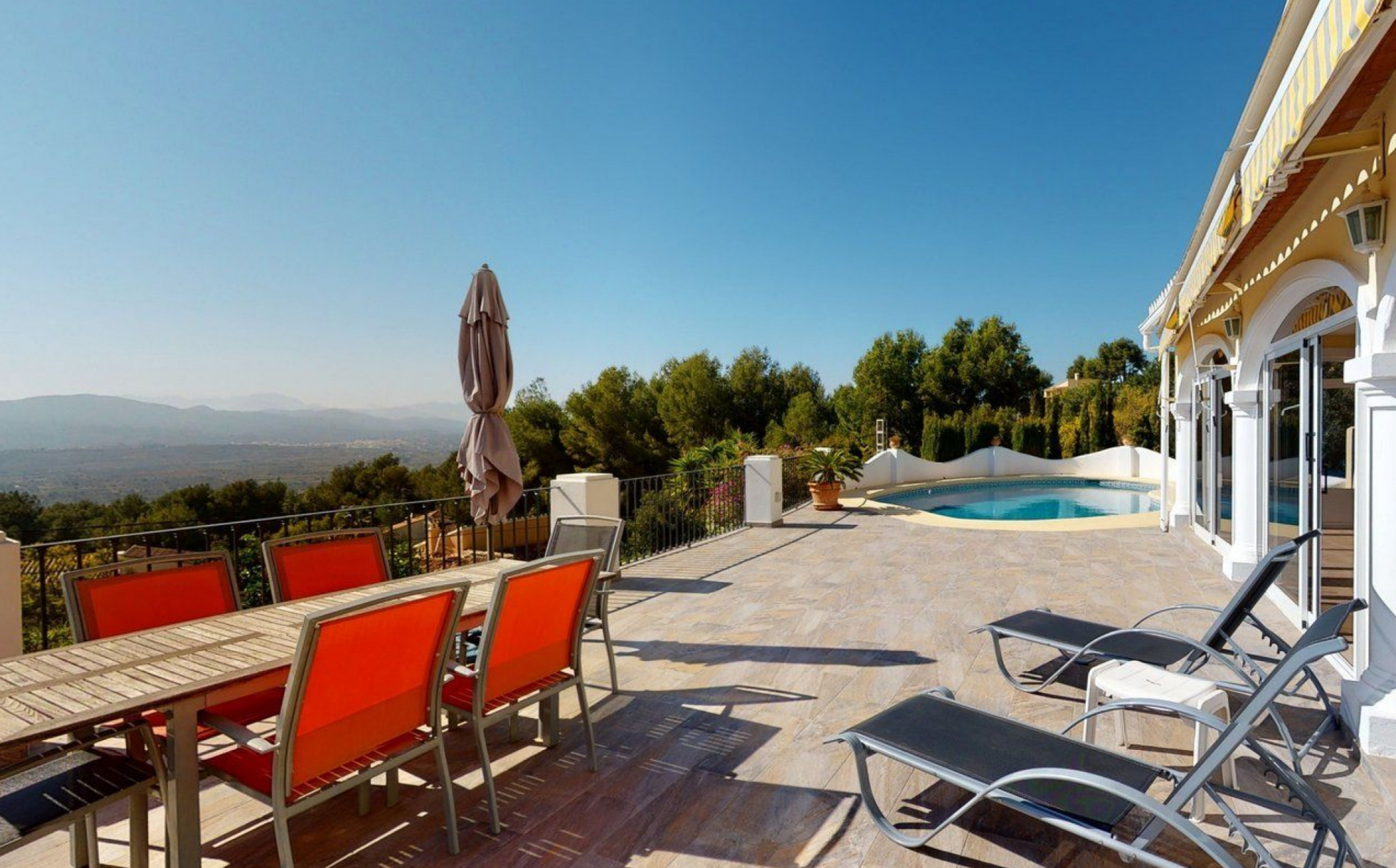
Villa sur le Montgó à Jávea avec vue dégagée MONTGÓ - PARTIDA TOSAL, JÁVEA/XÀBIA - REF. V-381