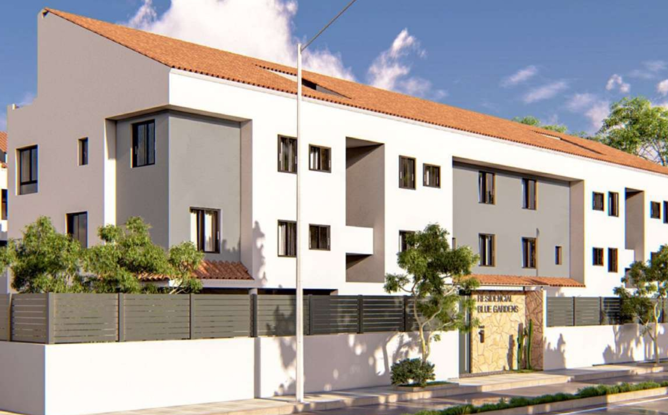
Eerste verdieping in BLUE GARDENS, JÁVEA MONTAÑAR - EL ARENAL, JÁVEA/XÀBIA - REF. BG313