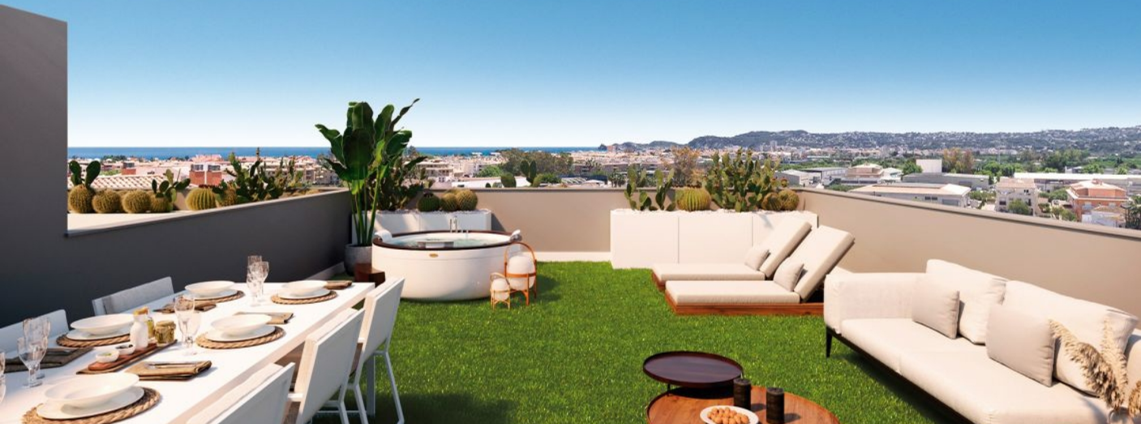
Nuevo residencial Essencial Jávea, ático de obra nueva con solárium y vistas al mar OUDE BINNENSTAD, JÁVEA/XÀBIA - REF. EB1-34