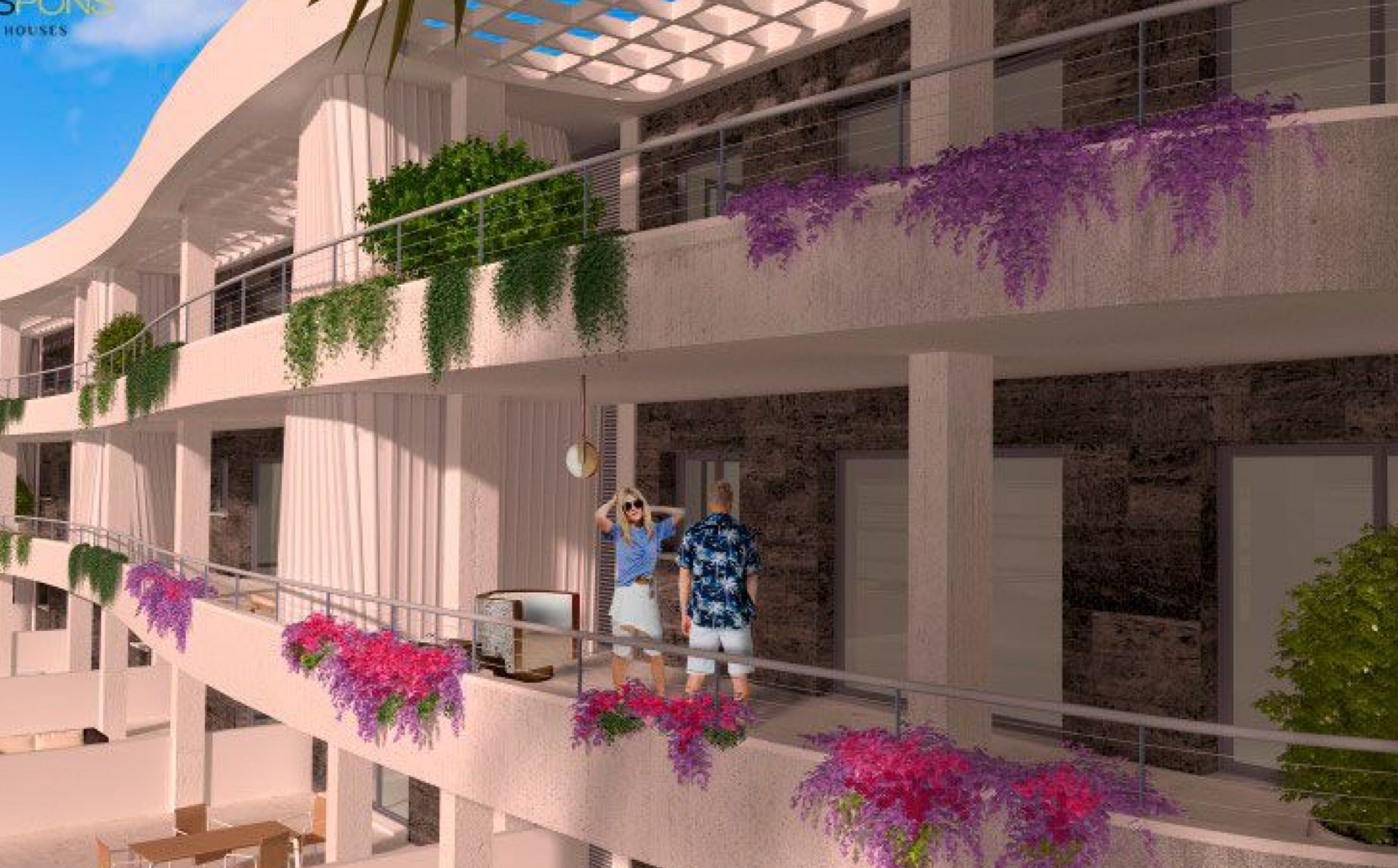
Planta baja con jardín en la playa del Arenal, Jávea. MONTAÑAR - EL ARENAL, JÁVEA/XÀBIA - REF. TERRAZAS COA