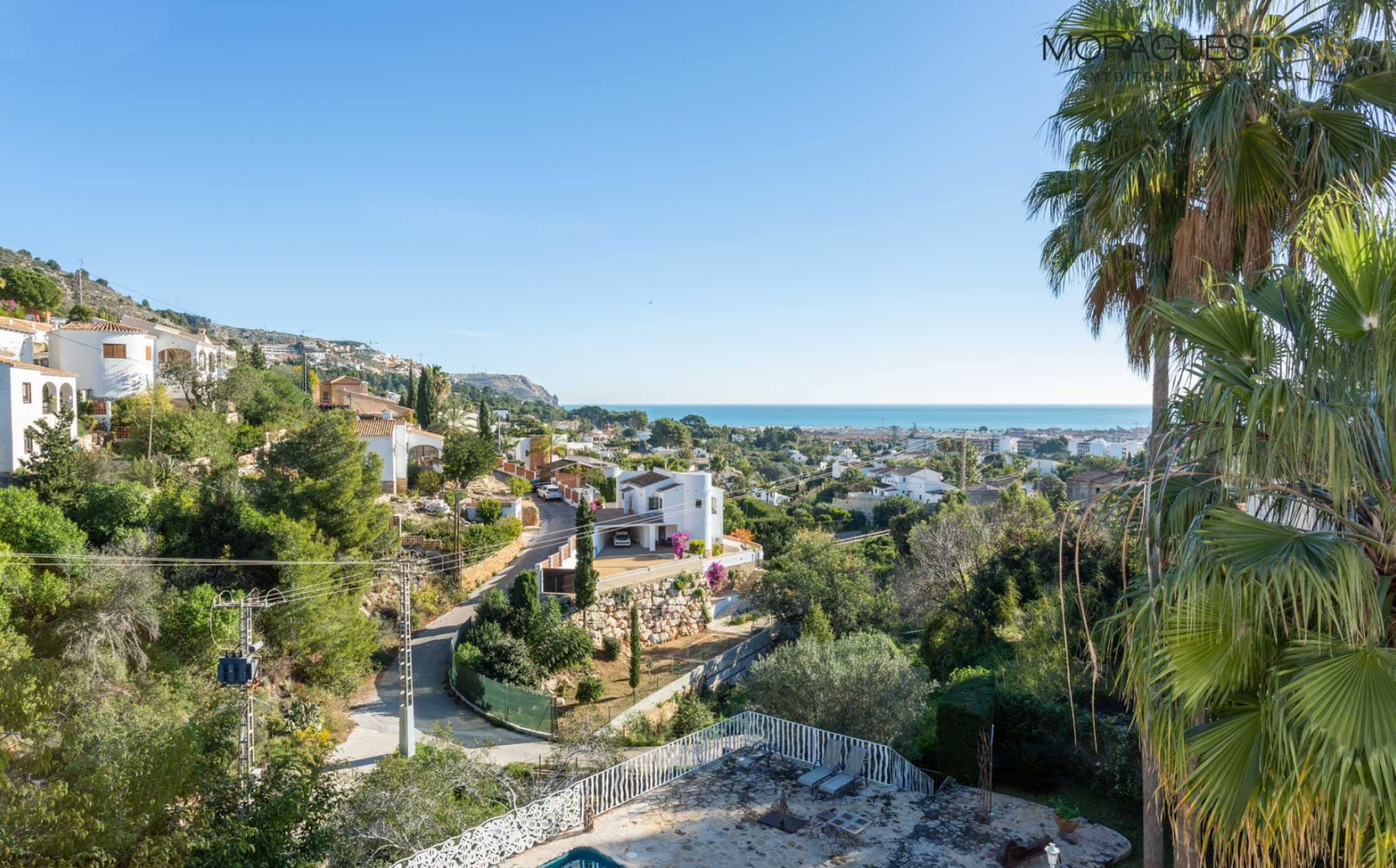
Villa met uitzicht op zee en groot perceel in Jávea CUESTA SAN ANTONIO - PUCHOL, JÁVEA/XÀBIA - REF. V-355