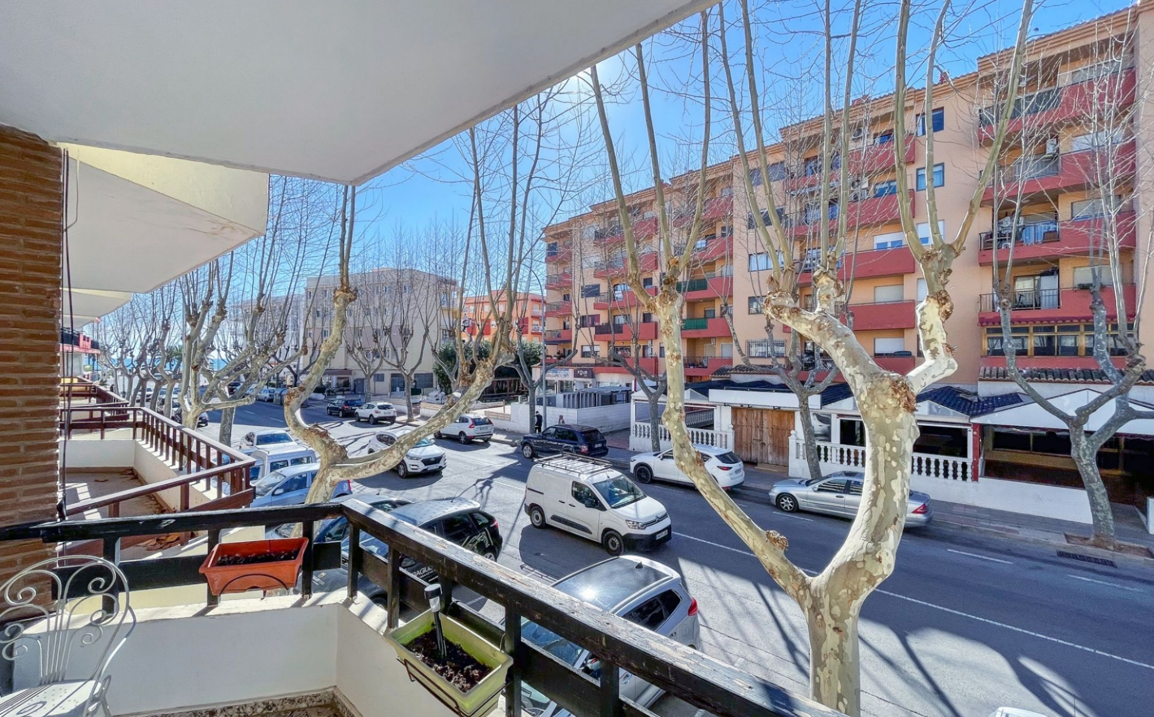
Appartement te koop in Jávea's Arenal Beach MONTAÑAR - EL ARENAL, JÁVEA/XÀBIA - REF. A-308