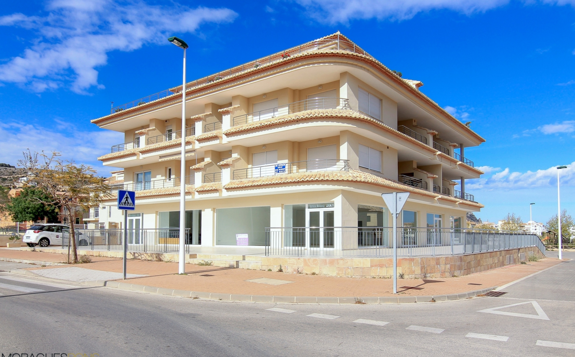
Apartamento en venta en el puerto de Jávea PUERTO, JÁVEA/XÀBIA - REF. A-391