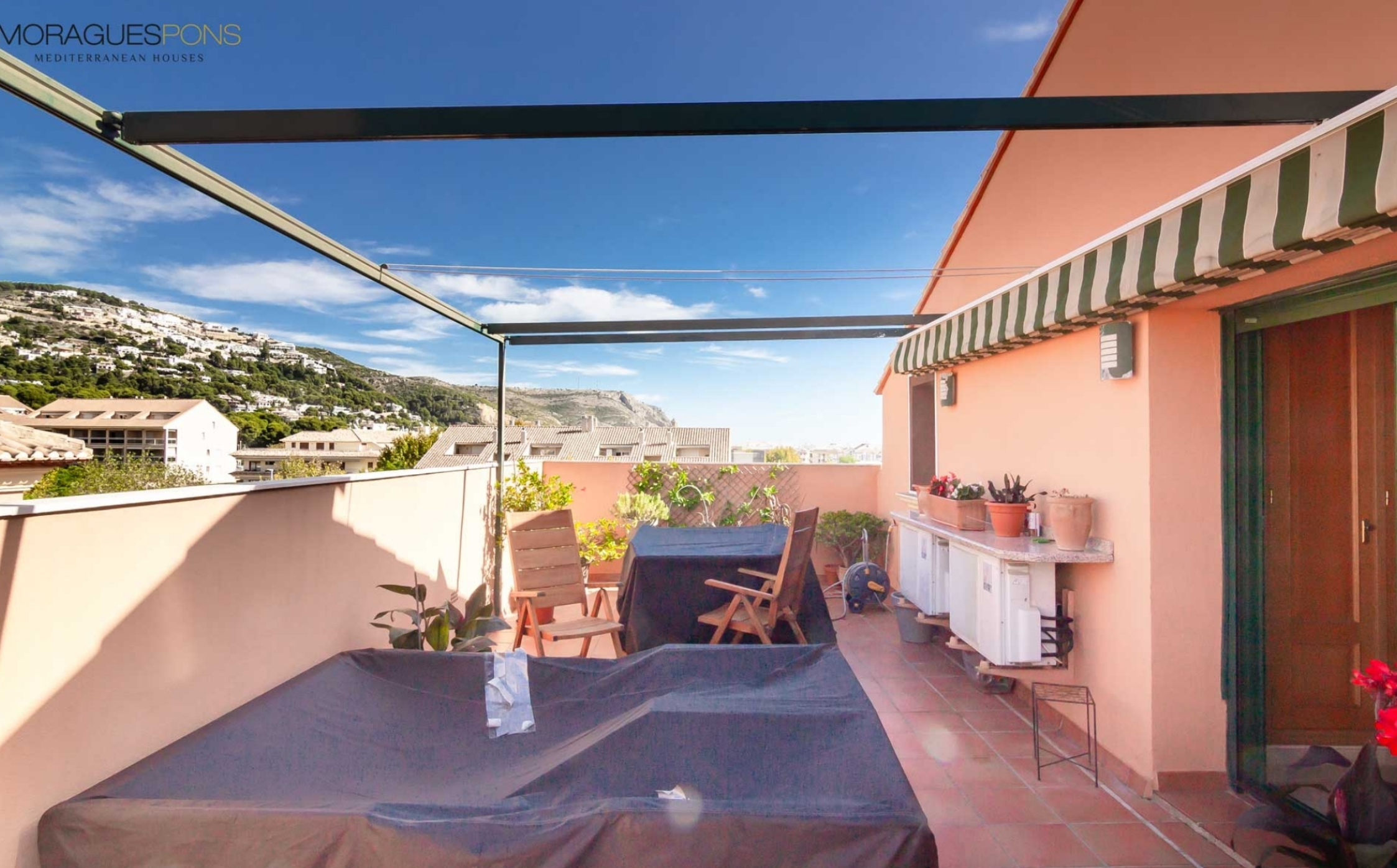
Ático dúplex en el Puerto de Jávea JÁVEA/XÀBIA - REF. A-309