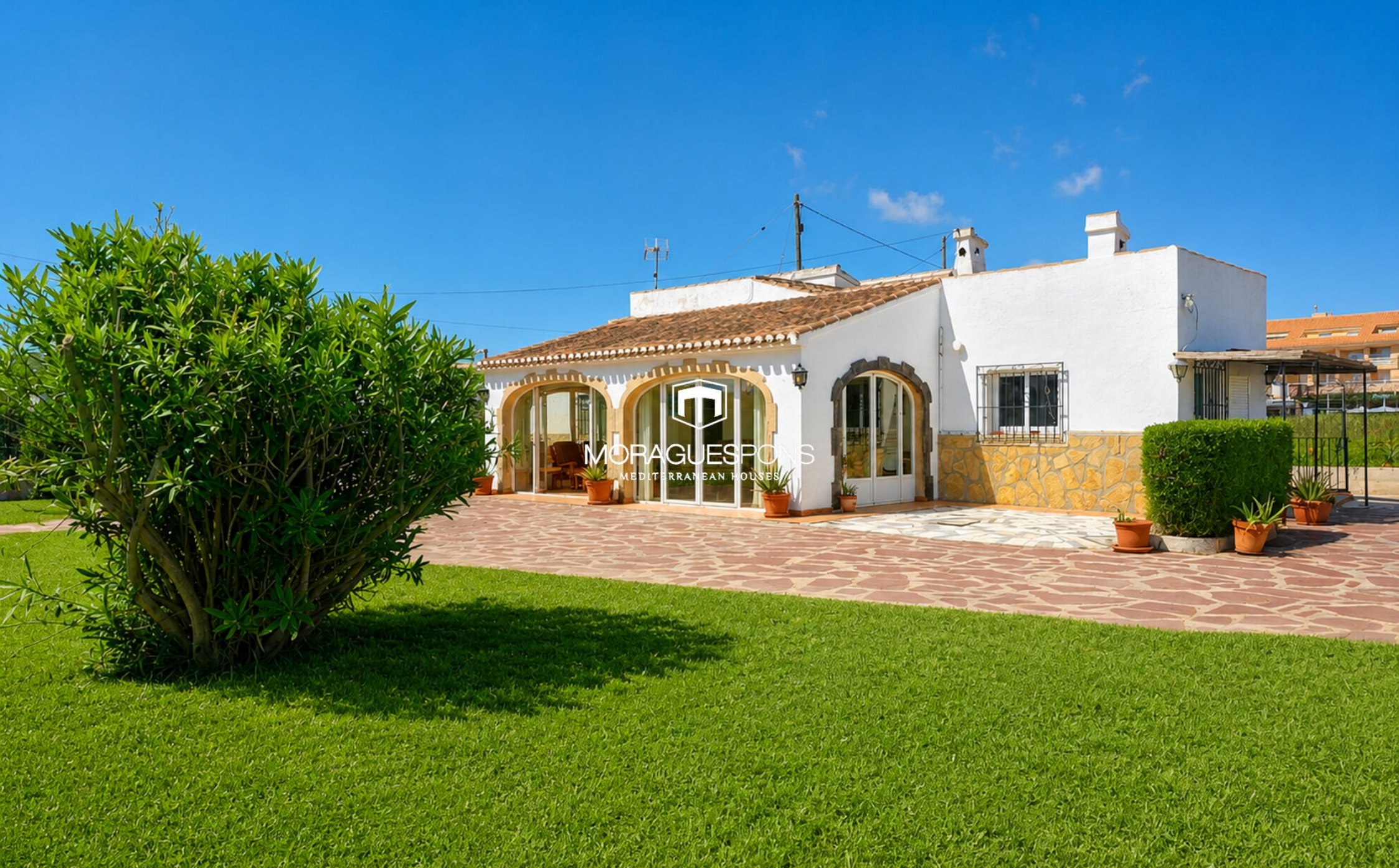
Villa con gran parcela a pocos pasos del Arenal de Jávea MONTAÑAR - EL ARENAL, JÁVEA/XÀBIA - REF. V-311