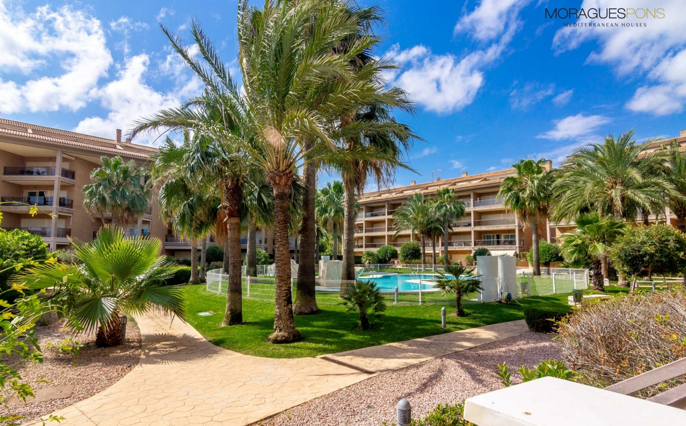
Planta baja en la playa del Arenal de Jávea. MONTAÑAR - EL ARENAL, JÁVEA/XÀBIA - REF. A-422