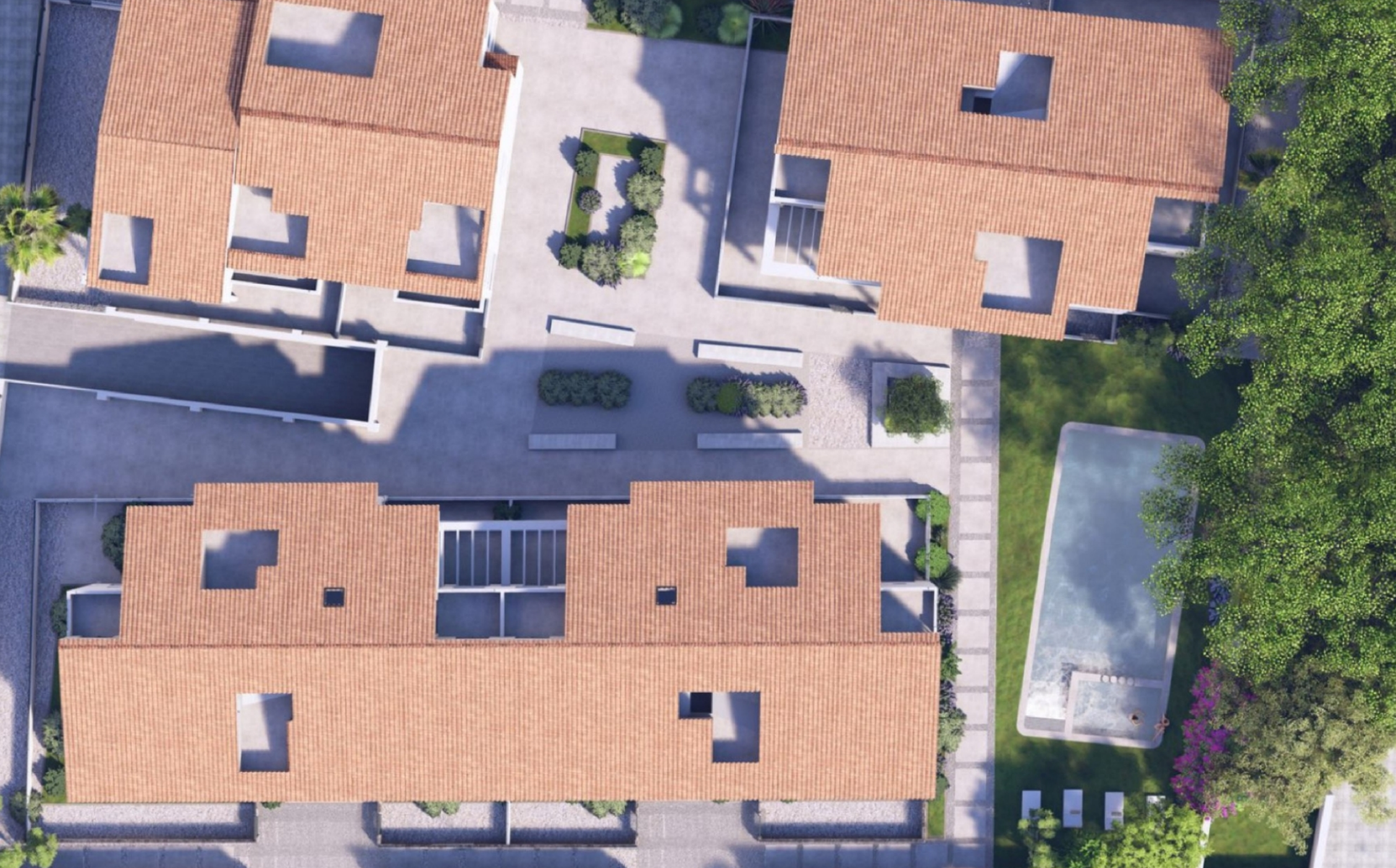
Primer piso en BLUE GARDENS, JÁVEA MONTAÑAR - EL ARENAL, JÁVEA/XÀBIA - REF. BG413