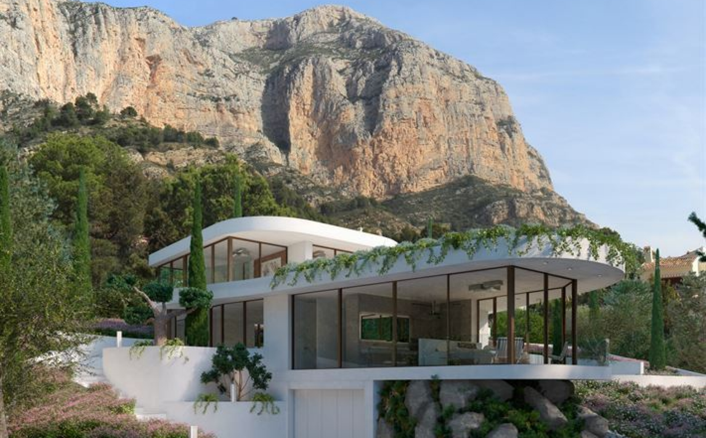
Villa Lavanda, nuevo proyecto en Montgó Nature. MONTGÓ - PARTIDA TOSAL, JÁVEA/XÀBIA - REF. V-203